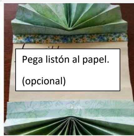
Pega listón al papel. (opcional)