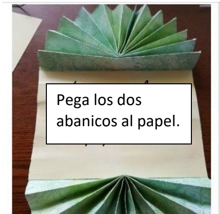
Pega los dos abanicos al papel.